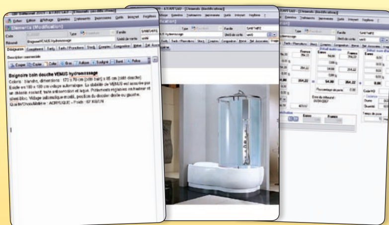
La bibliothèque interne vous permet de disposer de fiches éléments complètes pour décrire vos prestations.

Complètes, les fiches de vos éléments reprennent les principales informations dont vous avez besoin pour établir vos prix de vente (déboursé sec, frais généraux, prix de revient, bénéfice...). Vous pouvez établir une fiche de tarif contenant ou non la main d'œuvre, ajouter si besoin le barème de l'éco-contribution, et visualiser votre chiffrage en euros et en francs. Vous disposez également d'onglets pour décrire précisément votre prestation, ajouter une photo ou encore renseigner le nom du fournisseur.